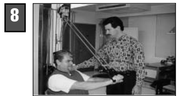
8 Rehabilitation Services Physical, Speech & Occupational Therapies, Wound Care and Audiology Services. No Slide Fee Scale Available. 830-B Scenic Drive Modesto, CA 95350 558-7000