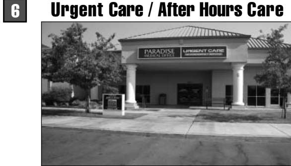
6 Urgent Care / After Hours Care 401 Paradise Road, Modesto 558-7000 Hours: 5:30 pm - 9:30 pm, Monday - Friday 10:00 am - 6:00 pm, Saturday and Sunday